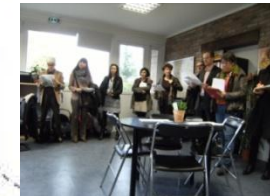
La Mobilité Solidaire